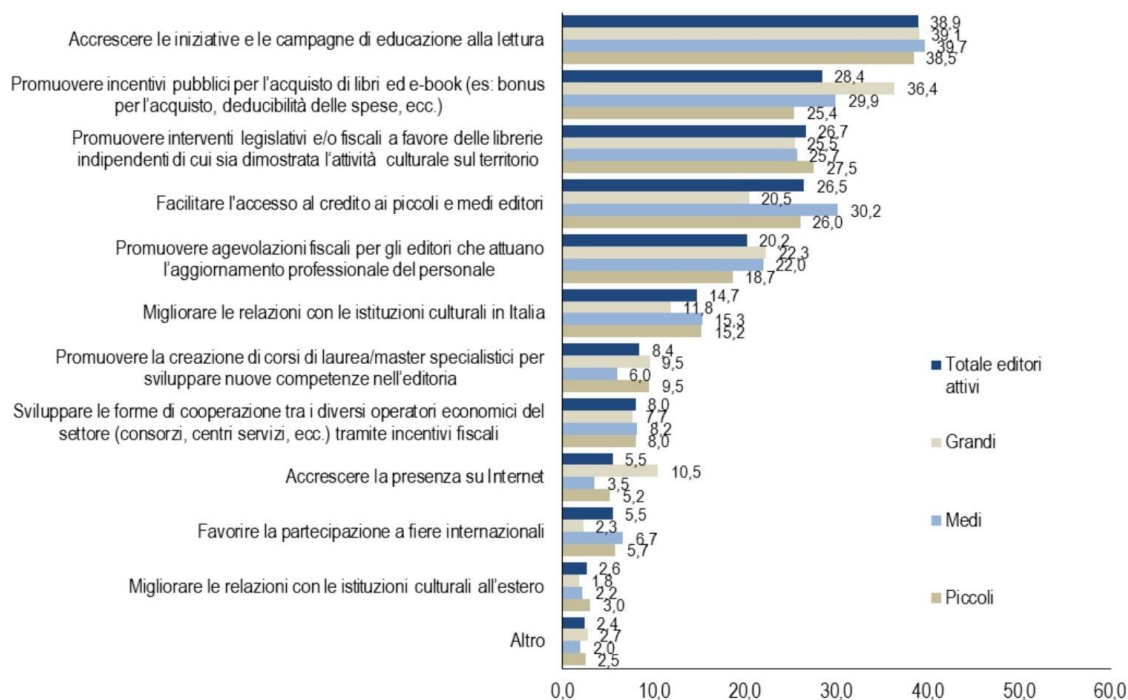
FIGURA 11. INTERVENTI CHE POSSONO CONTRIBUIRE MAGGIORMENTE ALLO SVILUPPO DEL SETTORE EDITORIALE, PER DIMENSIONE DELL'EDITORE (a). Anno 2017

(a) I valori si riferiscono agli editori "attivi" cioè quelli che hanno pubblicato almeno un'opera libraria nell'anno considerato, e in particolare si definiscono "piccoli" quelli che hanno pubblicato da 1 a 10 opere; "medi" da 11 a 50 opere; "grandi" oltre 50 opere.